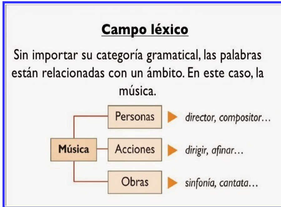
LÁMINA 1: LÁMINAS DE APOYO COMPRENSIÓN DE CONTENIDOS: CAMPO LÉXICO