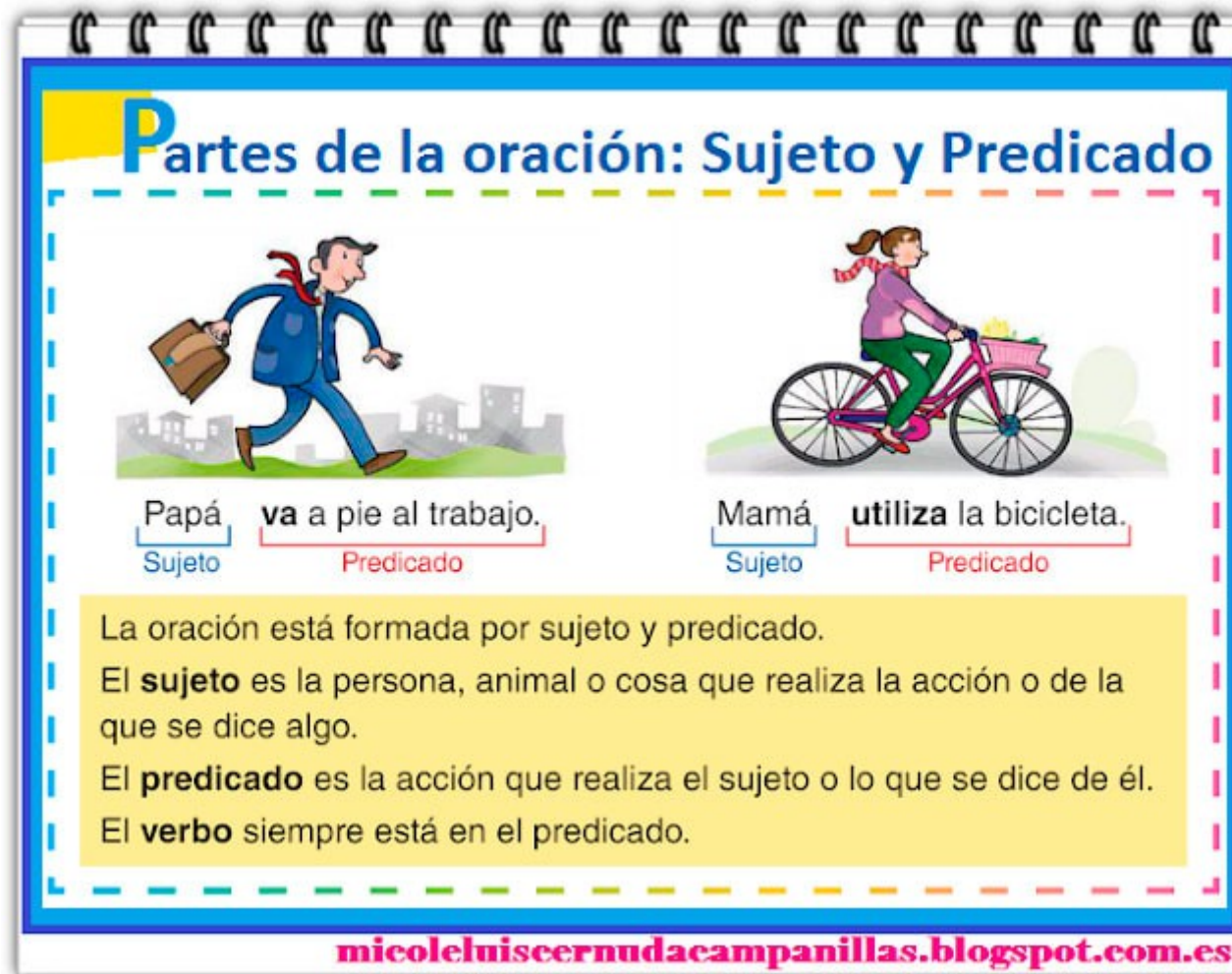
LÁMINA 3 / SUJETO Y PREDICADO