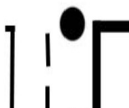
au coin de la rue