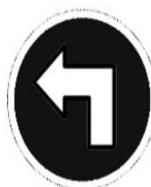
tourner à gauche