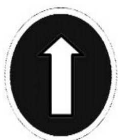
aller tout droit