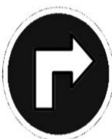
tourner à droite