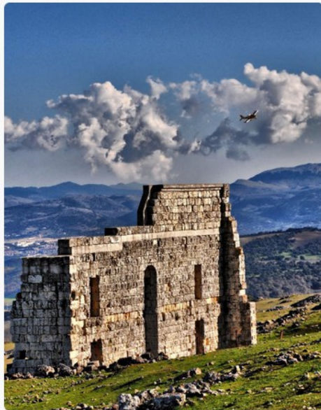
Teatro romano en las ruinas de Acinipo. Ronda La Vieja.

La presencia humana más antigua documentada en Ronda se remonta al Neolítico y a la temprana Edad del Cobre (milenios V – IV a.C.) con asentamientos de tipo estacional y se localiza en el actual barrio de la Ciudad. Sin embargo, la presencia del hombre por estas tierras es mucho anterior. De ella son buena prueba una serie de yacimientos en cuevas, entre los que destaca la Cueva de la Pileta, por ser uno de los mejores exponentes del arte rupestre del Paleolítico andaluz.