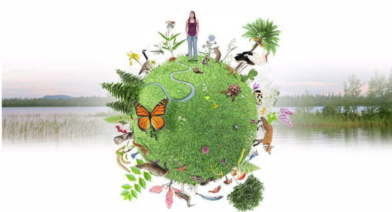
LÁMINA AYUDA AL CARTEL